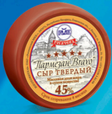
Сыр твердый «Пармезан Bravo»

МДЖ 45% 360 суток от 0 до +4 °С 8 кг 2 шт