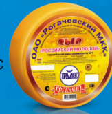
Сыр «Российский молодой»

МДЖ 45% МДЖ 50% 150 суток от 2 до +6 °С от 0 до +4 °С 8 кг 2 шт