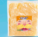
Сыр «Российский Традиционный»

МДЖ 45%, 50% 90 суток от -4 до +4 °С Нарезка – тертый, вакуум 200 г 11 шт