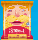
Сыр «Голландский Классик»

МДЖ 35%, 45% 150 суток от +2 до +6 °С Нарезка – брусок, МГС 200 г 30 шт