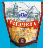
Сыр твердый «Пармезан Bravo»

МДЖ 45% 360 суток от 0 до +4 °С вакуум 100 г 12 шт