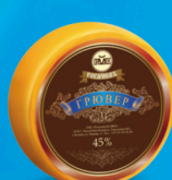
Сыр «Грювер особый»

МДЖ 45% 120 суток от 0 до +4 °С 8 кг 2 шт