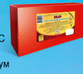
Сыр «Голландский брусковый»

МДЖ 45% 150 суток от 0 до +4 °С 4 кг 4 шт