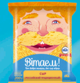
Сыр «Российский Традиционный»

МДЖ 45%, 50% 150 суток от +2 до +6 °С Нарезка – брусок, МГС 200 г 30 шт