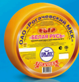
Сыр «Белая Русь»

МДЖ 45% 150 суток от 0 до +4 °С 8 кг 2 шт