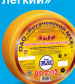
Сыр «Монастырецкий легкий»

МДЖ 35%, 150 суток от 0 до +4 °С 8 кг 2 шт