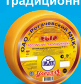
Сыр «Российский Традиционный»

МДЖ 35%, 45% 150 суток от 0 до +4 °С 8 кг 2 шт