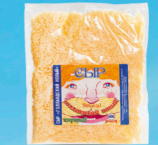
Сыр «Голландский Классик»

МДЖ 45% 120 суток от 0 до +4 °С Нарезка – тертый, вакуум 200 г 11 шт