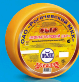
Сыр «Монастырский дар»

МДЖ 35%, 45% 135 суток, 150 суток от 0 до +4 °С 8 кг 2 шт