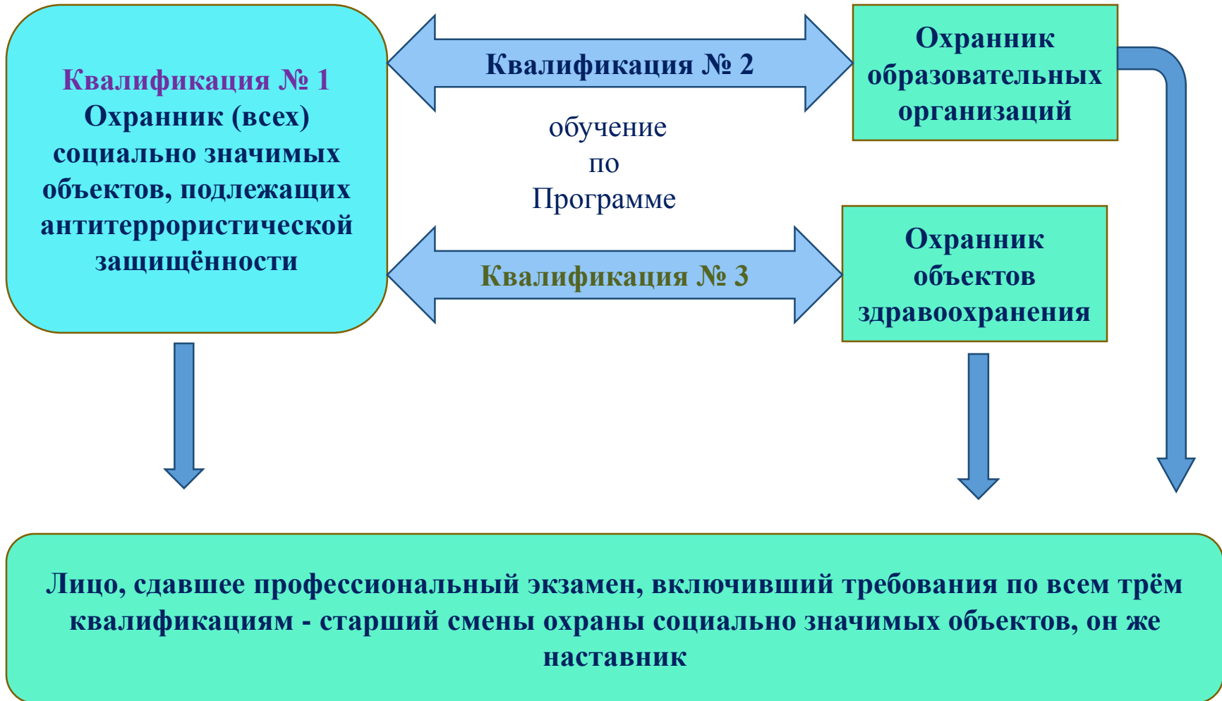
Схема профессионального обучения по профессиональному стандарту «Охранник социально значимых объектов, подлежащих антитеррористической защищённости»